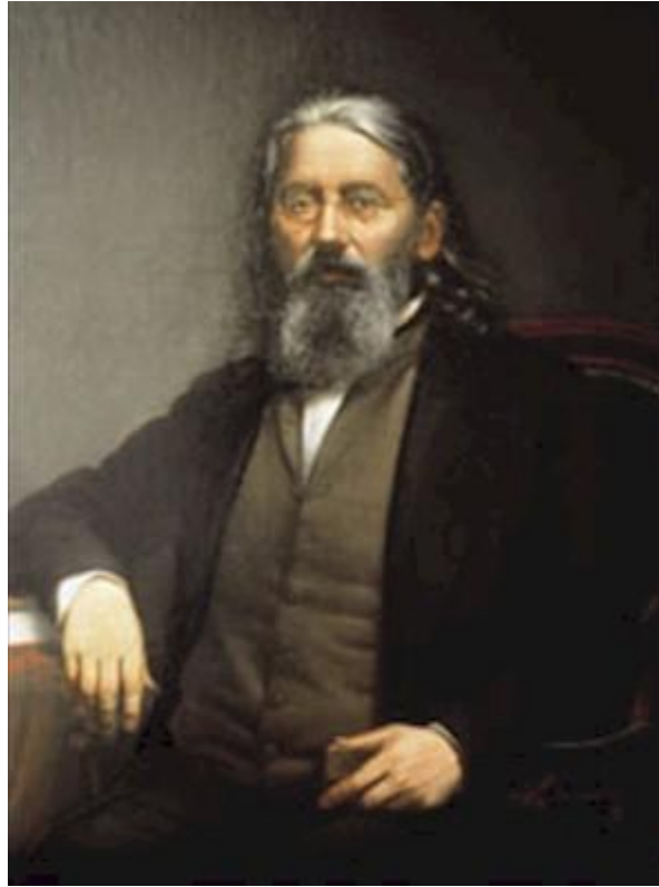
Professeur Constantin Hering (1800-1880)